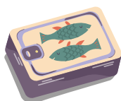
Olej z rybiček