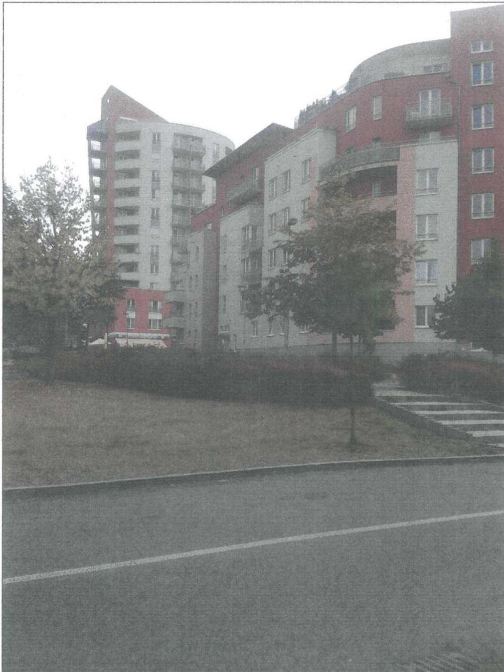
Obr. č. 1 - Stávající stav prostranství k revitalizaci - pohled z ulice Mattioliho do ulice Kamelova