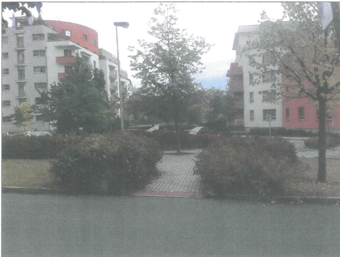
Obr. č. 3 - Stávající stav prostranství k revitalizaci - pohled z ulice Kamelova