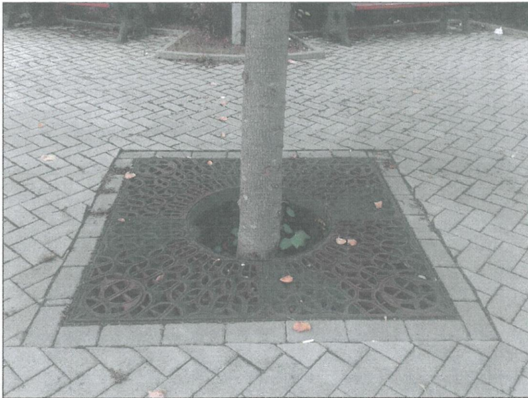
Obr. č. 6 - Detail - stávající stav prostranství k revitalizaci - centrální místo určené k revitalizaci s možností ponechání stromu na místě nebo s jeho odstraněním