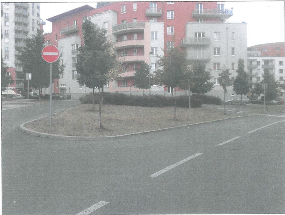
Obr. č. 4 - Stávající stav prostranství k revitalizaci - pohled z ústí ulic Mattioliho a Kamelova