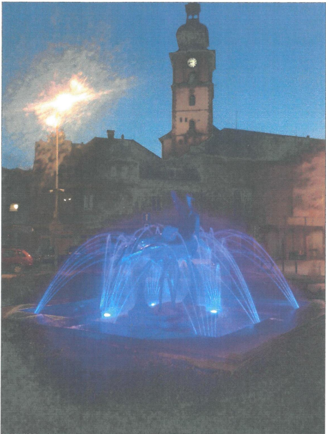
Obr. č. 9 - Inspirace - kašna s volavkami na kruhového objezdu ve městě Mimoň (v noci)