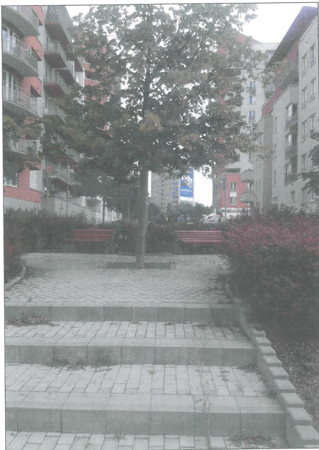
Obr. č. 2 - Stávající stav prostranství k revitalizaci - detail