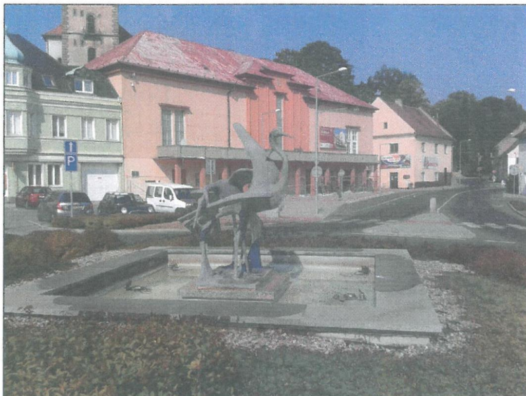
Obr. č. 7 - Instiprace - kašna s volavkami na kruhového objezdu ve městě Mimoň (přes den)