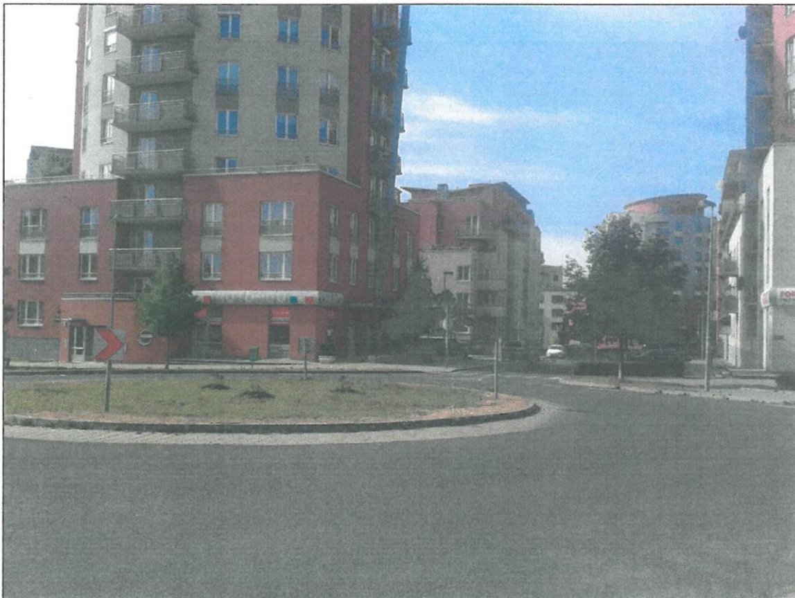
Obr. č. 1 - Stávající stav prostranství k revitalizaci - centrální místo určené k revitalizaci