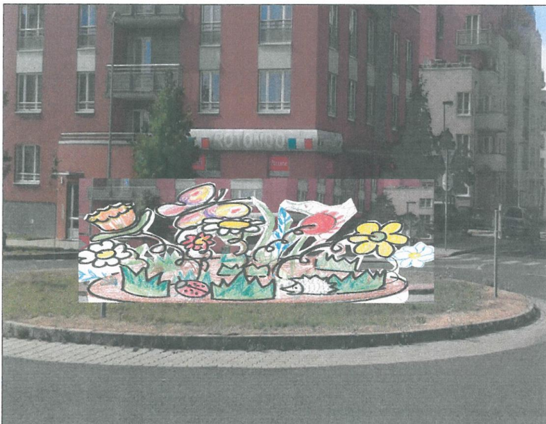
Inspirace č. 1