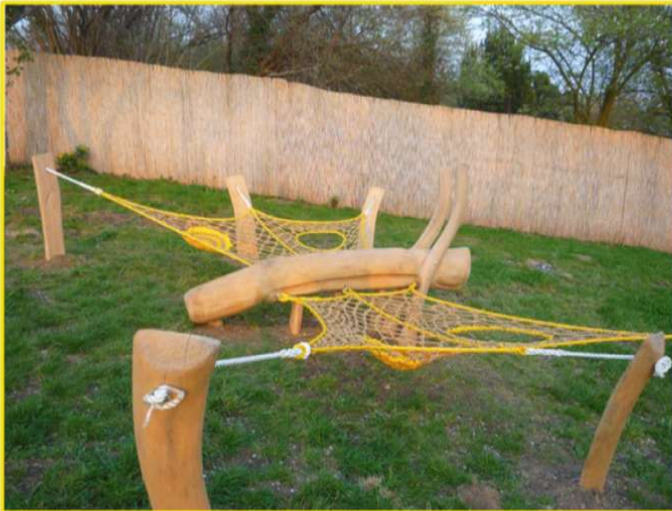
Relaxační sítě v Botanické zahradě, 2014, Botanická zahrada Praha