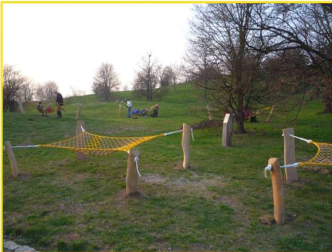
Relaxační síť v Botanické zahradě, 2014, Botanická zahrada Praha